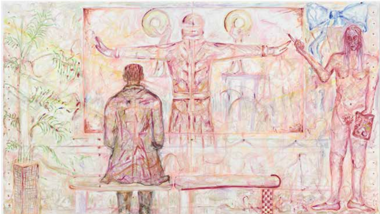
Bond Freud National Gallery, 2016 Courtesy Galerie Buchholz, Berlin/Cologne/New York © Jutta Koether