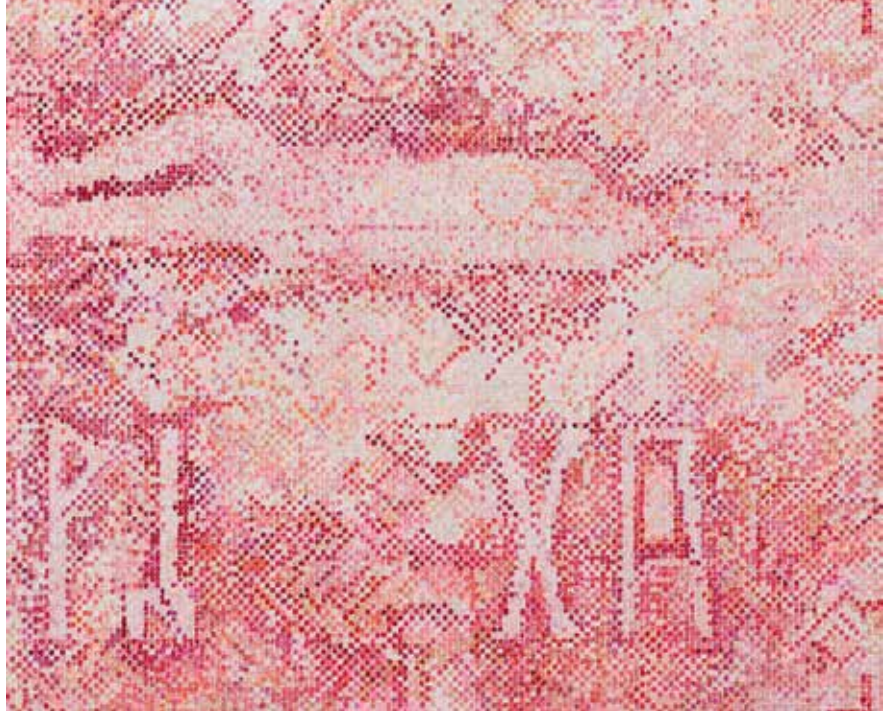
Tour de Madame 4 , 2018 Courtesy Galerie Buchholz, Berlin/Cologne/New York © Jutta Koether