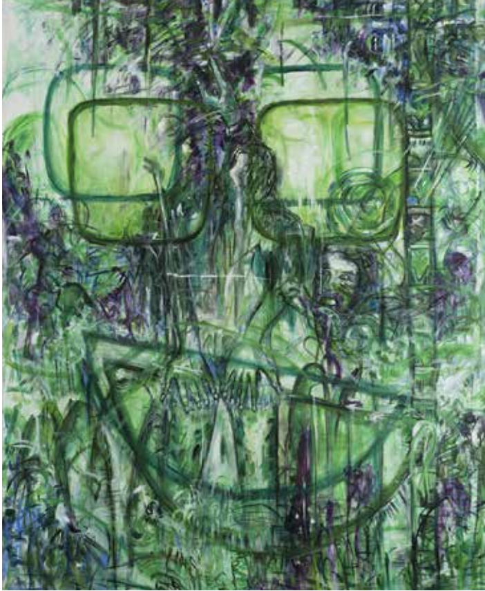
Mède, 1992 Courtesy Galerie Buchholz, Berlin/Cologne/New York © Jutta Koether