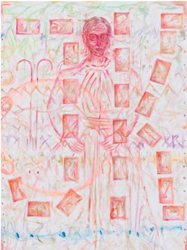
Tour de Madame 15 , 2018 Courtesy Galerie Buchholz, Berlin/Cologne/New York © Jutta Koether