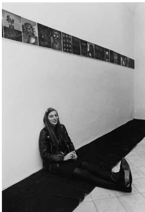
Galerie Bleich-Rossi, Autriche, 1987 © Jutta Koether