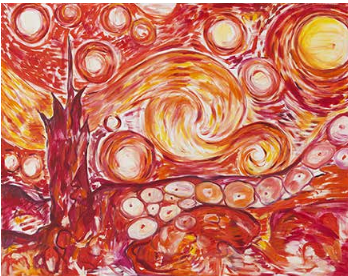
Starry Night II , 1988